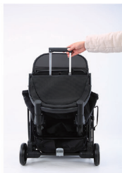
1. Вытащите большую ручку