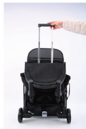
2. Потяните маленькую ручку