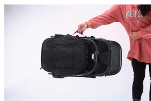
4. Допускается использование боковой ручки для переноса