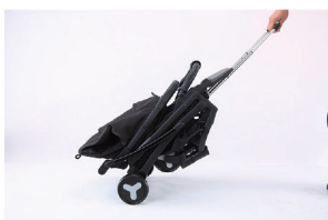
3. Коляска готова к перевозке